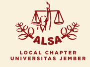
LOCAL CHAPTER UNIVERSITAS JEMBER