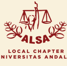
LOCAL CHAPTER UNIVERSITAS ANDALAS