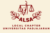
LOCAL CHAPTER UNIVERSITAS PADJAJARAN