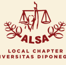
LOCAL CHAPTER UNIVERSITAS DIPONEGORO