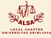
LOCAL CHAPTER UNIVERSITAS SRIWIJAYA