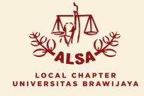
LOCAL CHAPTER UNIVERSITAS BRAWIJAYA