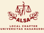
LOCAL CHAPTER UNIVERSITAS HASANUDDIN