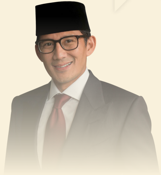
Dr. H. Sandiaga Salahuddin Uno, BBA., MBA.

Saya memuji kegiatan akademik yang diselenggarakan ALSA seperti ini, mahasiswa betul-betul melakukan aktivitas yang dapat mendukung kegiatan akademik, tidak hanya perkuliahan secara umum. Tetapi disini ALSA mampu mendatangkan pembicara yang memiliki latar belakang dan perspektif yang berbeda, sehingga mahasiswa dapat memperoleh informasi yang beragam yang dapat mengaitkan pemahaman tentang suatu isu. Saya sangat mengapresiasi ALSA