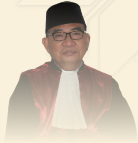
Hj. Ahmad Yunus, S.H., M.H. Hakim Tinggi Pengadilan Tinggi Palembang

ALSA itu bagus, telah menunjukkan kemampuan generasi muda untuk maju kedepan. Saya pernah mendampingi ALSA dalam moot court , dan saya menilai bahwa mutu daripada anggota yang bergabung di ALSA ini telah menunjukkan prestasi dalam bidang akademik